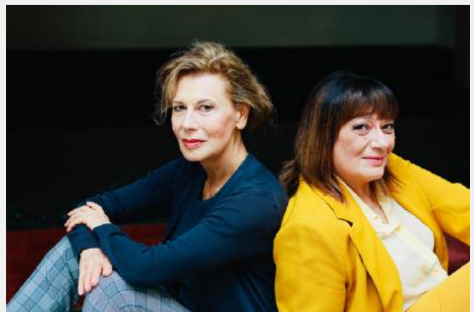
Foto Mariella Nova Gianni Franzoni Foto Daniela Poggi Carlo Bellinazzi

particolare per un uomo dalla parte giusta che vorrebbe cancellare la storia sbagliata dei violenti.