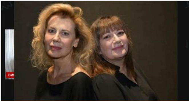
fatto che diventi "normale" sentir parlare di femminicidi.

"Figlio, non sei più giglio": il titolo della piece scritt... voutu ha